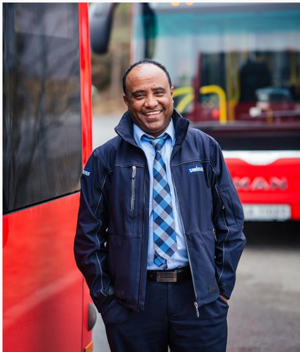
Førerkort klasse D. Yrkessjåførbevis.