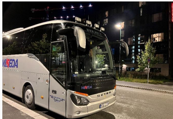
Scandic Helsfyr 27.09.22