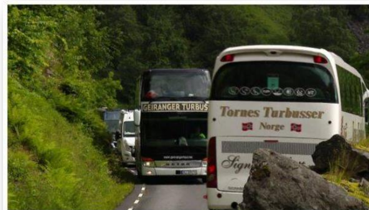
Smalt: Dette var situasjonen på Ørnevegen i Geiranger i dag. Bussane som fekk køyreforbod var av utanlandsk opphav. Bildet viser altså ikkje bussar som fekk køyreforbod.